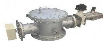
写真：ランスレス高炉3Dプロファイルメータ

所在地 尼崎市名神町1丁目12番9号 設立 1984年 資本金1,000万円 従業員数15名