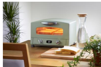
写真：グラファイトトースター