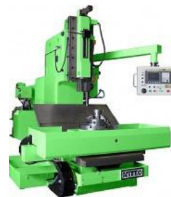
写真：大型スロッターマシン NVS-360

所在地 多可郡多可町中区安楽田5番地 設立 1958年 資本金 2,100万円 従業員数 32名