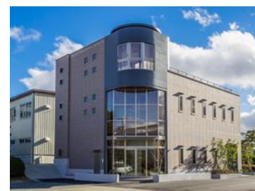
写真：2014 年に開設した近畿メカノケミカル研究所

所在地 神戸市中央区栄町通 4 丁目 2 番 18 号 設立 1948 年 資本金 6,500 万円 従業員数 180 名